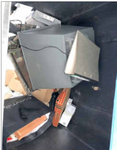
25. Januar 2019, Fernseher im Papiercontainer